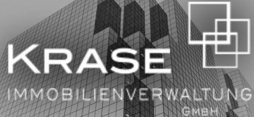
Krase Immobilienverwaltung GmbH, Hamburg