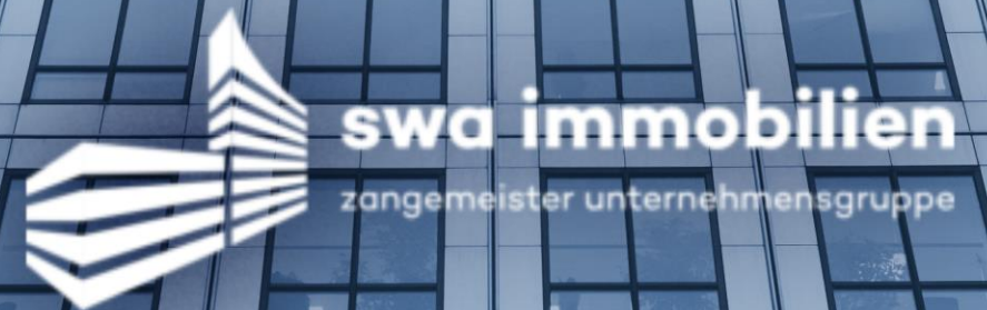
SWA Immobilien GmbH, Leipzig