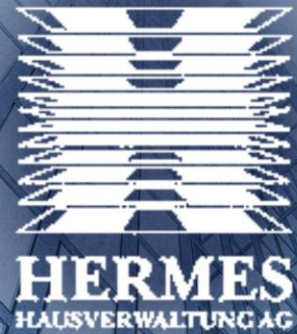
HERMES Hausverwaltung AG, Berlin