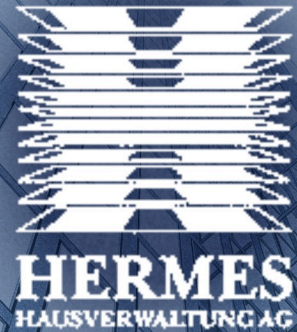
HERMES Hausverwaltung AG, Berlin