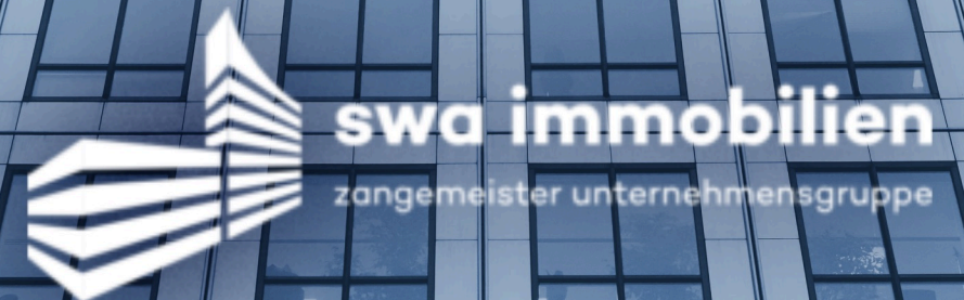
SWA Immobilien GmbH, Leipzig